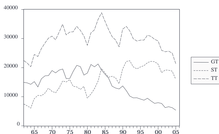
FIGURA 1 – MEDIA SPETTATORI IN SERIE A

raggiungimento di medie oltre i 20.000 nei primi anni '80. Da questo punto in poi la serie mostra una chiara inversione di tendenza con un trend fortemente negativo che, attualmente, ha condotto il dato a livelli davvero bassi, intorno alle 5.000 unità, pari a circa 1/3 rispetto al dato dell'inizio degli anni '60. Dall'altro lato vi è stata nel tempo una leggera tendenza positiva del numero di ST, tendenza che sembra rallentare e bloccarsi a partire dalla metà degli anni '90. Il dato complessivo relativo ai TT presenta quindi un andamento «approssimativamente» a parabola, il cui vertice è posizionato al 1983. Nella figura 1 sono riportate le tre serie storiche relative alle variabili sopra indicate.